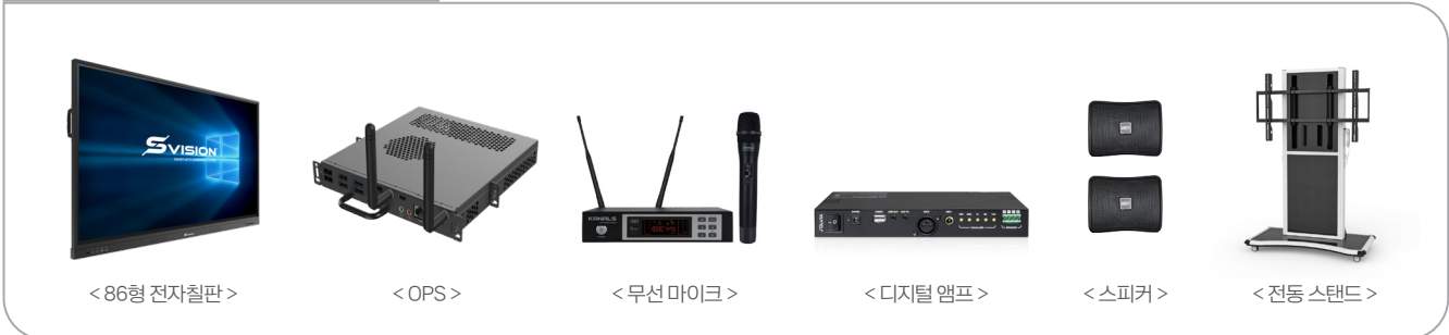
< 86형 전자칠판 >